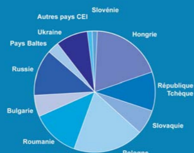
Pays d'origine des Coperniciens

Votre contact : Hélène Feau Tél. : 33 (1) 49 54 72 76 Email : copernic@cdi.fr